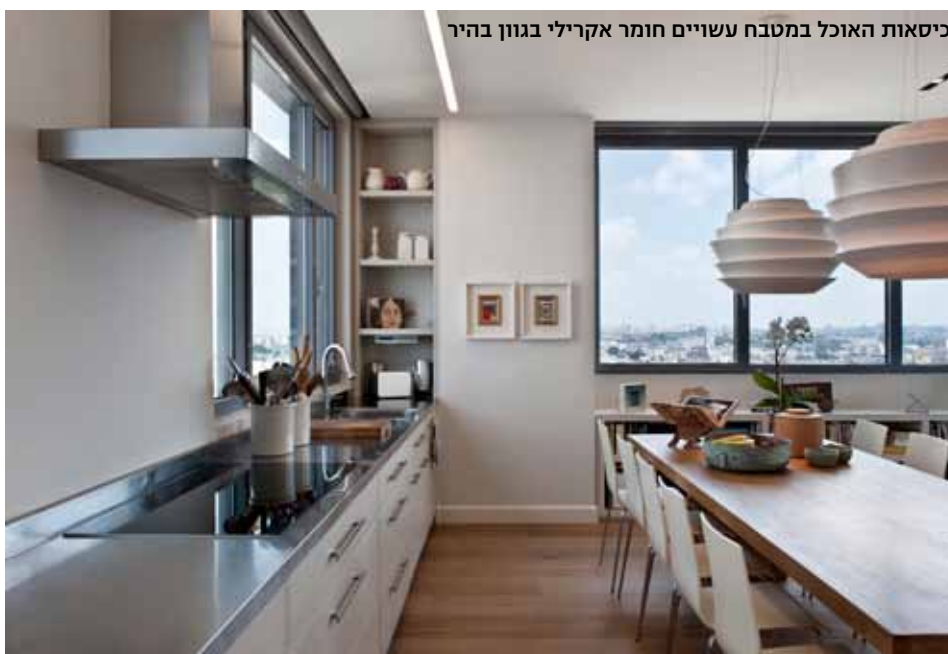
כיסאות האוכל במטבח עשויים חומר אקרילי בגוון בהיר

והיכרות מעמיקה של הלקוחה עם האמן ותהליכי העבודה שלו. בניגוד לתהליכי עבודה סטנדרטים, חלוקת החללים ועיצובם בוצעו בהתאם לעבודות האמנות שקבעו את האווירה, הצבע והקצב. חללי הפנים תוכננו מחדש. בניגוד לתכנון המקורי, בעלי הדירה הסתפקו בשלושה חדרים. הראשון הוא סלון עם מטבח פתוח ופינת קריאה, המופרד באמצעות דלת מהחלק הפרטי. רצפת החלל חופתה בפרקט עץ אלון. מסדרון הכניסה, בו ממוקמת ספרייה מרשימה, מוביל אל הסלון בו בולט שטיח ארוג