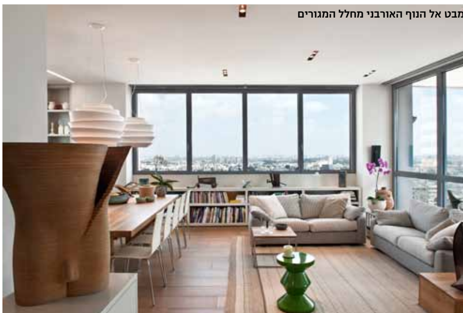
מבט אל הנוף האורבני מחלל המגורים

אחרי שנים בהם גרו בפנטהאוז דו-משפחתי החליטו השניים להתקרב