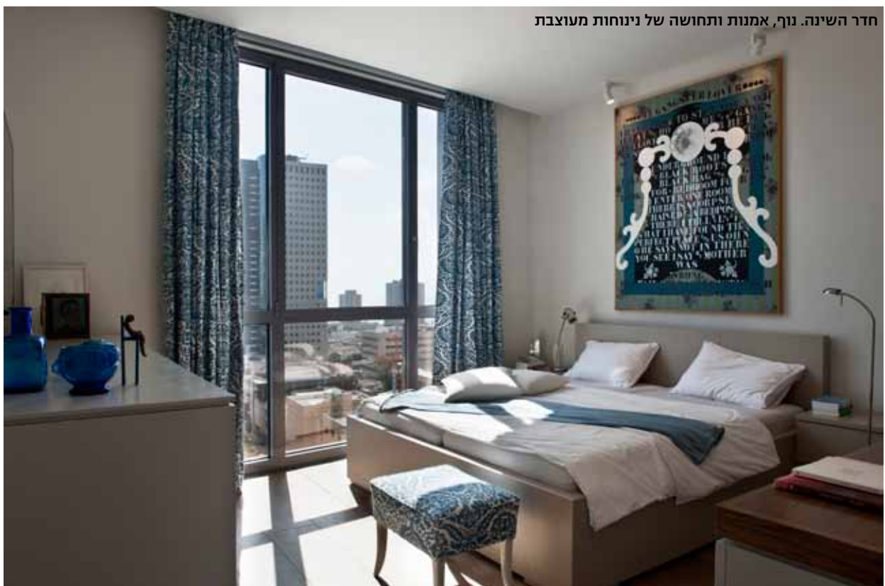
חדר השינה. נוף, אמנות ותחושה של נינוחות מעוצבת