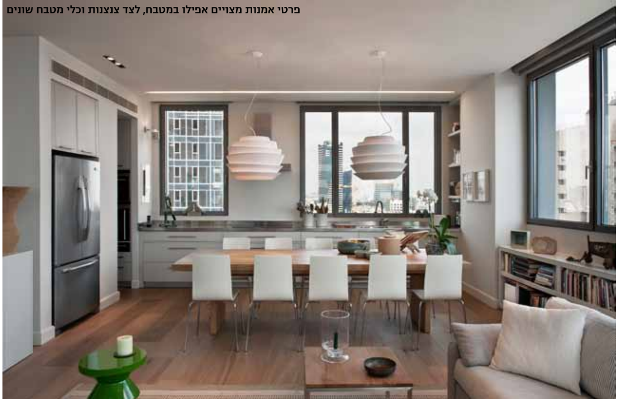
פרטי אמנות מצויים אפילו במטבח, לצד צנצנות וכלי מטבח שונים

כסאות האוכל עשויים חומר אקרילי בגוון בהיר, ומעל – שתי מנורות תלויות. דלת דו-כנפית בין שתי נישות מובילה לאזור המגורים הפרטי, הכולל חדר שינה, חדר עבודה/אירוח ושני חדרי רחצה, שרופפו כולם באריחים גדולים בעבודת יד – פרחים לבנים על רקע אפור. אוסף ספרי המדע, האמנות וההיסטוריה של בני הזוג צומצם עם המעבר לדירה החדשה. תמיר תכננה עבורם ספריות רבות בגוון בהיר שהותאמו לגובהם התחתון של חלונות הוויטרינה כך שהמדף העליון שלהן משמש כבמה להצבת <