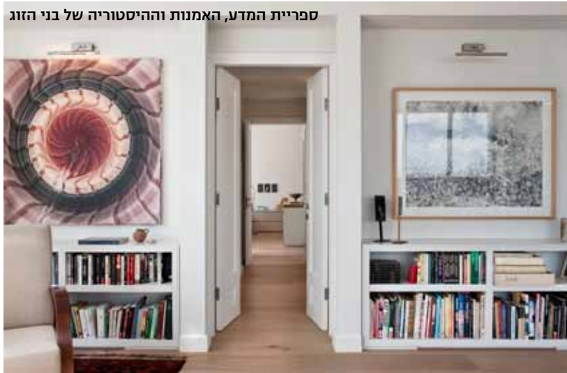
ספריית המדע, האמנות וההיסטוריה של בני הזוג

המעצבת ובעלת הבית הקפידו לבחור, מבין ארסנל היצירות, כאלה שאינן משתלטות בגודלן על החלל. מרבית עבודות הציור הן על נייר, מונוכרומטיות, ותלויות במרווח