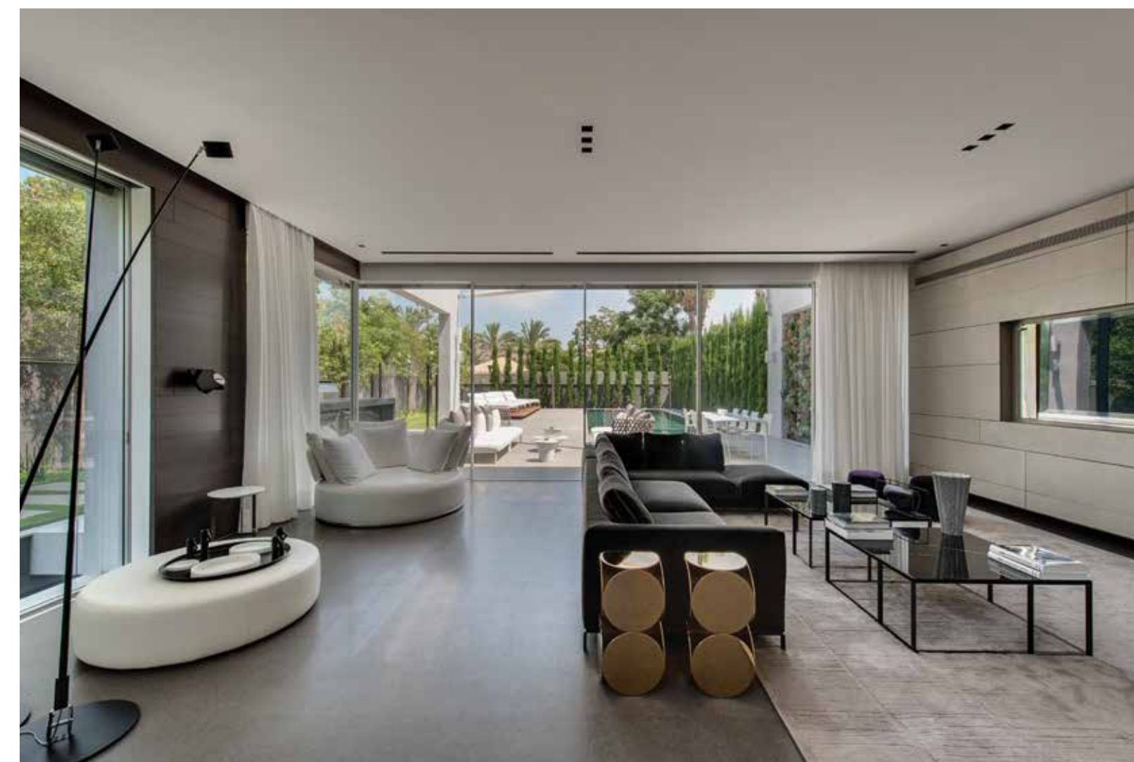
A House in Herzliya. Top: View from the living room – breaking the modern language by using velvet sofas and wooden cover. Opposite page: Top: A sitting area next to the pool. Bottom left: A double height space and a family place that located close to the kitchen. Bottom right: Large openings through which you can see the outside. The garden is reflected from every corner of the house, creating an infinite feeling and connection to nature.